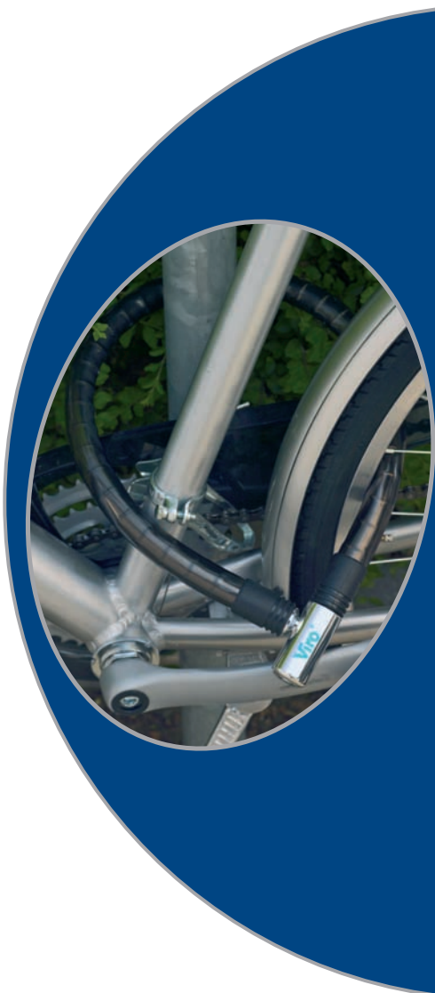
ø 25 mm. bedekt met semi-transparant blauw PVC