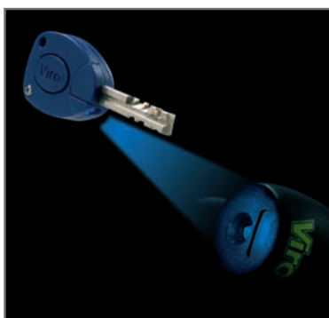
Blauwe sleutel met een handig lampje voor verlichting van het slot