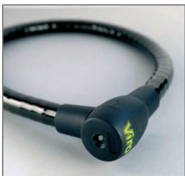
Slot beschermd tegen weersinvloeden