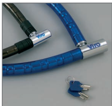
Bedekt met krasbestendig PVC