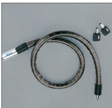
Sleutels met ergonomische handgreep