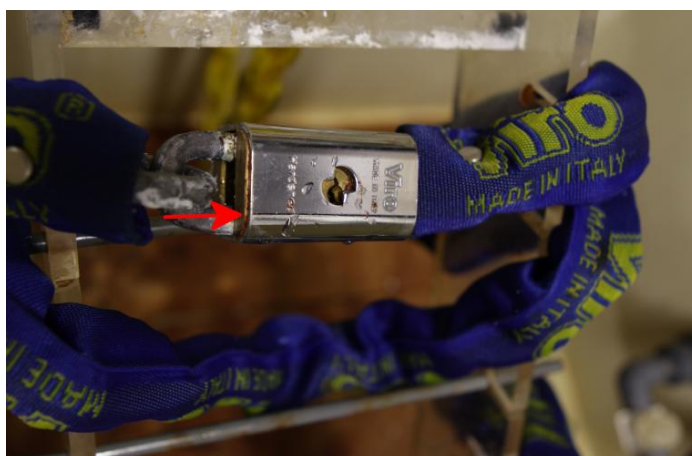
Blocca catena na de zoutnevel test

We zien wat kleine roestplekjes op op de rand van het slothuis. Deze hebben geen negatieve invloed heeft op de veiligheid van het slot. De buitenkant van het slot en de mechaniek vertonen geen sporen van roest.