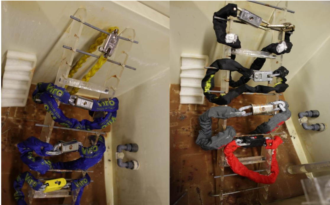
Links de originele Viro sloten na de test, rechts de imitatie sloten

We richten onze aandacht op de Blocca catena en de copie ervan.