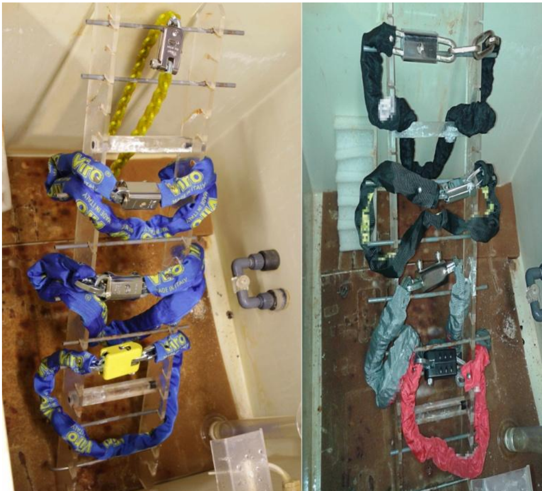
(Links de originele Viro sloten in de zoutnevelmachine, rechts de imitaties)

Allereerst hebben we een roestbestendigheidstest uitgevoerd met behulp van zoutnevel