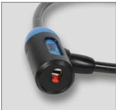
Meccanismo ricoperto in ABS antigraffio. Serratura protetta contro l'aggressione degli agenti atmosferici