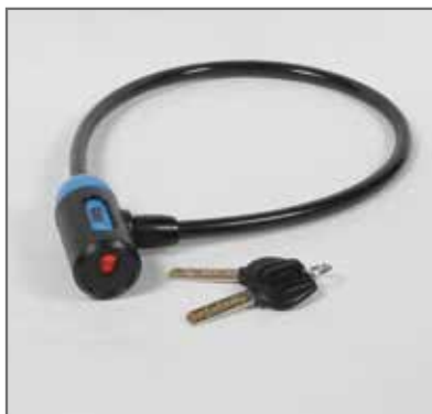
Chiavi con impugnatura ergonomica