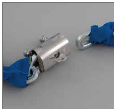
Catena semiquadra di sezione 10 mm in acciaio speciale al manganese, cementato e temprato, protetta da guaina in tessuto blu che minimizza l'ingombro