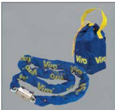
Forniti di comoda borsa da trasporto, in tela di nylon. Barilotto protetto contro lo strappo ed il trapano