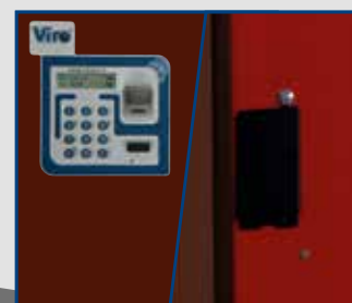
Segnali acustici/visivi ed una gradevole etichetta con semplici istruzioni d'uso, applicate sullo sportello che guidano l'utilizzatore. Scheda elettronica a basso consumo. Alimentazione interna con 4 pile stilo alcaline da 1,5V. Segnalazione tramite display e segnale acustico di batterie in esaurimento. Memoria non volatile: l'assenza delle batterie non cancella le impronte né i codici né i dati nell'archivio