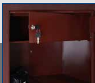
Tesoretto portamunizioni/portaoggetti dotato di serratura Fai by Viro con 2 chiavi in dotazione. Ripiani con dimensioni adatte a riporre anche pc portatili e tabulati (kit ripiani confezionato separatamente)